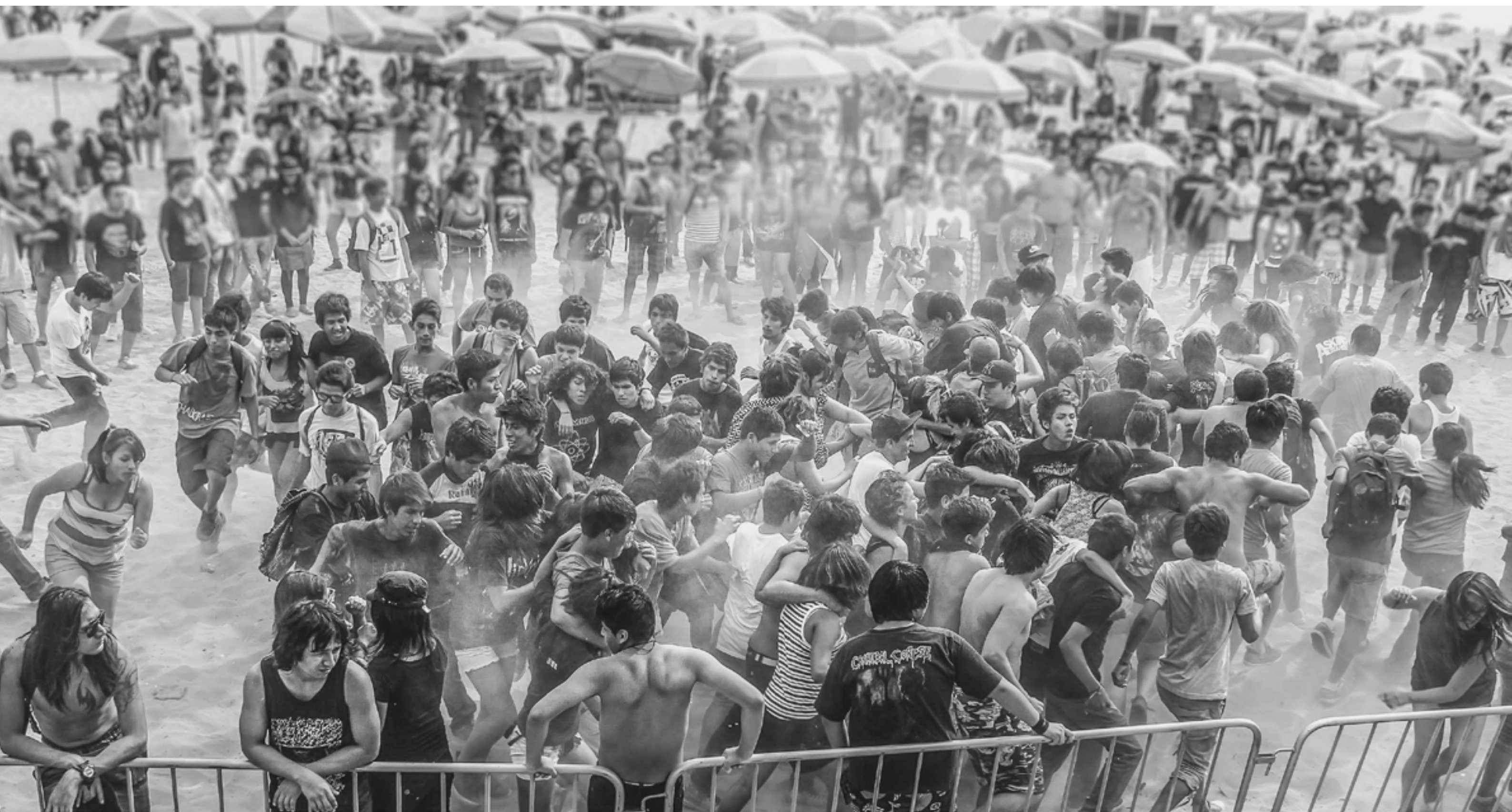
Rock en la Playa 2015.